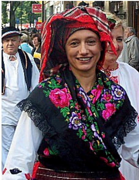
Menschen mit Migrationshintergrund. Eine kroatische Umzugsteilnehmerin.

Den Auftakt machte traditionell die Stuttgarter Stadtgarde zu Pferd, die dem Block "1.300 Jahre Cannstatt" vorausritt. In diesem Block war alles vertreten, was Cannstatt heute ausmacht und wasenkompatibel ist: die Trachtengruppe des Kübelesmarktes, der Cannstatter Bläserkreis, der marschierte, während sich der Cannstatter Musikverein auf einem Gefährt zusammendrückte. Der Cannstatter Volksfestverein mit seinen Trachten, seinen Kindergruppe war ein High-light. Das Ehepaar Pfeffer, als Büttel und Bütteline in der Sauerwasserstadt bekar stehen auch für die Jugendarbeit im Volksfestverein. Der Garternbauverein war dabei mit seinem Chef Wilhelm Bauer, dem "Boskoop" auf dem Wagen. Die Cannstatter Wengerter mit ihren Vorständen Gerhard Schmid und Fritz Raith zelebrierten den legendären Rohrtrunk, aus der Zeit, wo Cannstatt seine Steuern noch ans Kloster Konstanz abzuliefern hatte. Die Stadtkirche trat mit der mittelalterlichen Gruppe "Cosmas und Damian" an - die Kirchengemeinderäte traten als würdige mittelalterliche Vertreter auf, sogar ein real existierender Dekan namens Dinkelaker marschierte im Volkfestumzug mit. Der Bezirksbeirat Bad Cannstatt hatte einen Oldtimerbus gechartert und die Riesenesel der Wilhelma, die dem Bezirksbeiratsbus