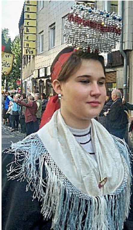
Hausacher Tracht im Volksfestumzug

Erfreulicherweise und eigentlich normal in einem Stadtbezirk, wo jeder zweite Einwohner einen Migrationshintergrund hat, wie es neudeutsch heißt. Viele ausländische Kulturgruppen marschierten im Zug mit: Portugiesen, Spanier, Kroaten, Slowenen ... da war es nahe liegend, dass in diesem Block Werbung für das im kommenden Jahr in Bad Cannstatt stattfindende Europäische Narrenfest gemacht wurde.