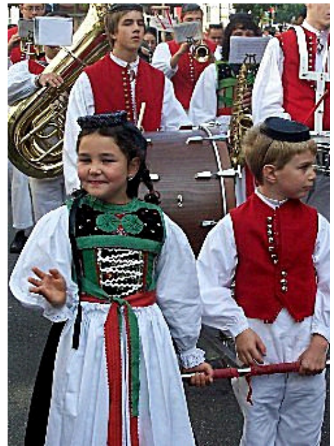
So wird die große Trommel bewegt: Keine Kinderarbeit, sondern Spaß pur

In der Gruppe "Historisches" waren wilde Ritter, Landsknechte, das Artillerie-Corps aus Büttgen-Forst in Nordrhein-Westfalen zu sehen. Dieses Corps führte eine vier Tonne schwere Kanone, die voll funktionsfähig ist, in Bad Cannstatt aber im Gegensatz zu anderen Volksfesten, nicht abgefeuert werden darf.