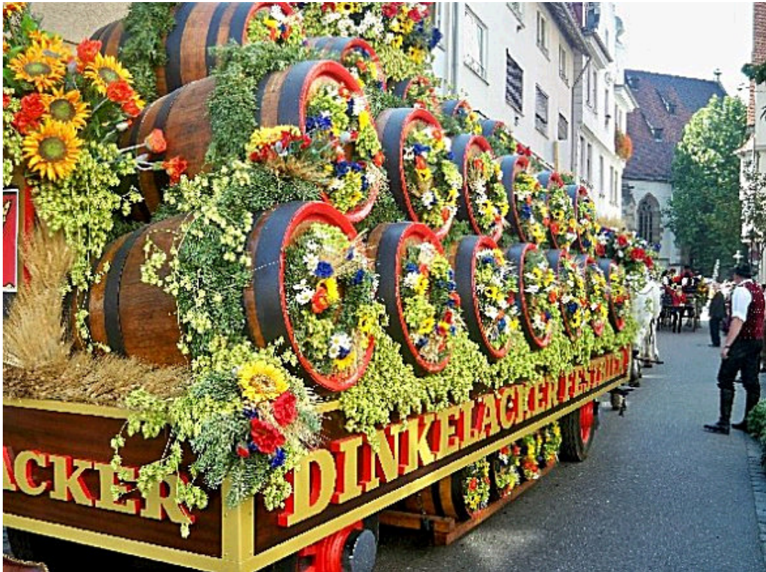
Die prächtigen Brauereiwagen waren auch dieses Jahr ein Hingucker beim Volksfestumzug.

Das große Volksfestspektakel, der Umzug in diesem Jahr war heute ab 11 Uhr wieder der große Zuschauermagnet. Weit über 200.000 Menschen hatten sich entlang der Umzugstrecke, vom Cannstatter Kursaal ausgehend über die König-Karl-Straße, die Wilhelmsstraße, die Brunnenstraße bis in die Marktstraße hinein, wo die Kameras des Südwestfernsehens auf den volksfestlichen Lindwurm warteten. Vor dort aus führte der Weg über den Wilhelmsplatz hinweg über die Seelberg-, Frösnerstraße hin zum Bahnhof und von dort ging es Richtung Wasen, wo sich der Zug auflöste. 3.500 Teilnehmer in neun Blöcken waren in diesem Jahr dabei. Es war eine Augenweide und es gab ordentlich was auf die Ohren für die Tausende von Zuschauer entlang des Umzugsweges.