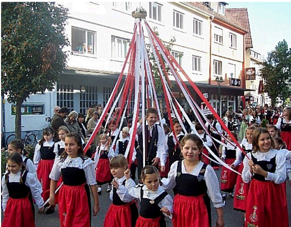
Die Jugendgruppe des Cannstatter Volksfestvereins: Ein nicht zu übersehender Farbtupfer im diesjährigen Umzug.

folgten, waren keineswegs als Anspielung auf den Inhalt des vorausfahrenden Busses gedacht, ehe ein Zufall in der Zugkomposition, wie das Management bestätigte.