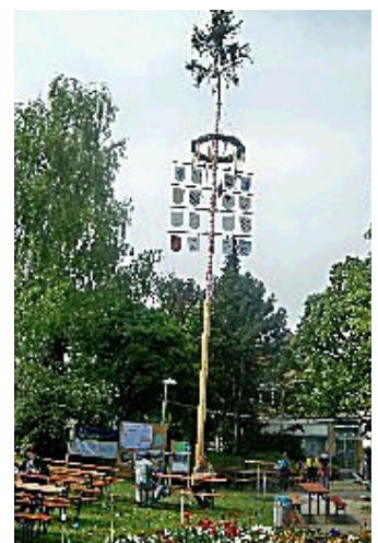
Ein einladender Festplatz der Hofener Kelterplatz

Auch in Steinhaldenfeld hat die Siedlergemeinschaft wiederum einen Maibaum errichtet, unter dem eine stattliche Schar gestern den