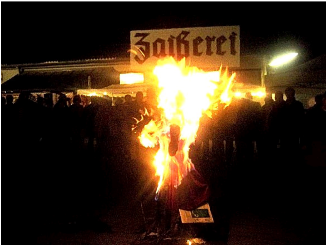
Das Symbol des Winters, die Hexe wurde in der Walpurgisnacht in der Zaißerei pünktlich um Mitternacht verbrannt - der Mai ist gekommen.

Gleich am ersten Mai geht es am Neckarstrand in der Zaißerei weiter, die Musik spielt, der Dieter Zaß singt und die Küche strengt sich an, die vielen hungrigen Mäuler, die Kaffeesüchtigen zu bedienen. Dieses Programm geht am Sonntag in die letzte Runde, nachdem der Samstag zum Wiederauflade der Kräfte des Personals benötigt wird und deswegen morgen geschlossen bleibt.