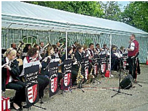
Der Musikverein "Frei Weg" verwöhnte in Mühlhausen die Gäste musikalisch.

Besondere Höhepunkte waren die Auftritte der ausländischen Mitbürger, die in einem Stadtbezirk wie Bad Cannstatt, wo jeder zweite Cannstatter über einen Migrationshintergrund verfügt, inzwischen einfach dazu gehören: Der kroatische Kulturverein "Velebit", der slowenische Pendant SKUD und die portugiesische Folklore Truppe "Rancho Folclórico Dança e Cantares" begeisterten mit ihren Volkstänzen, wobei die Portugiesen als Beitrag des Cannstatter Kulturvereins "s Dudelsäckle" auftraten.