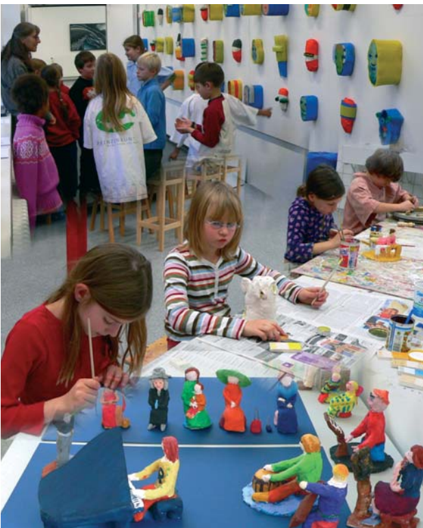
Spaß legt den Grundstein für ein lebenslanges Lernen.

Wir wollen die Bildungsangebote für lebenslanges Lernen fördern, beginnend im Kindergarten, in Schulen, Hochschulen, Bibliotheken, in der beruflichen wie in der kulturellen Bildung, um die notwendige geistige Mobilität von Jung und Alt und das Lernen voneinander und miteinander zu ermöglichen.