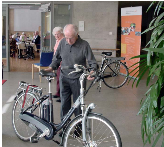
Pedelecs – mit Elektroantrieb geht es leichter.

Besucherdienste, altengerechte Wohnungen, Mittagstische und Alternholung unterstützen ältere Menschen in ihrer Selbstbestimmung und Selbstständigkeit. Die Zahl der Angebote trägt dazu bei, dem Bedürfnis nach Kontakt, Unterhaltung und Teilhabe gerecht zu werden. Dazu gehören auch seniorenfreundliche Angebote im ÖPNV durch den VVS und eine sichere Stadt, zu der die gemeinsa-