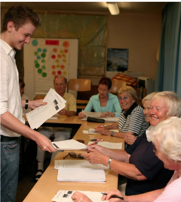
Schüler geben als Lehrer Erlerntes weiter.

Wir wollen durch viele gute Beispiele deutlich machen, dass es ein persönlicher Gewinn und eine Bereicherung für das eigene Leben ist, wenn man sich für ältere beziehungsweise jüngere Menschen engagiert.