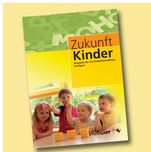
Die Broschüre stellt Ziele für ein kinderfreundliches Stuttgart vor.

Immer mehr Erwachsene mit Zeitressourcen und sozialer Kompetenz fördern vor allem jene Kinder, die in anregungsarmen Entwicklungsmilieus aufwachsen, sowie junge Familien, die keine nachbarschaftlichen oder verwandtschaftlichen Kontakte haben. Seit Januar 2006 können Eltern im Rahmen der „Initiative Z – Zeit und Herz“ die Beratung und Unterstützung von Familienpaten in Anspruch nehmen. Sie stehen ihnen in Fragen der Alltagsorganisation, Erziehung und Freizeitgestaltung zur Seite. Das Projekt, das vom Jugendamt initiiert und zwei Jahre lang von der Eduard-Pfeiffer-Stiftung finanziell gefördert wurde, erfreut sich einer so großen Nachfrage, dass eine ständige Warteliste besteht. Seit 2008 ist die Finanzierung fest im Haushalt der Landeshauptstadt verankert.