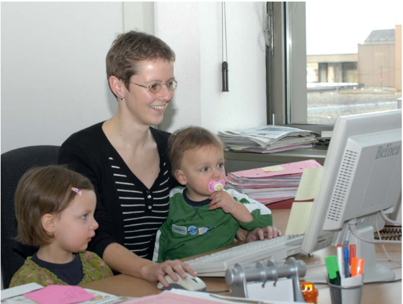
Familienfreundliche Unternehmen helfen Müttern, Kinder und Beruf zu vereinbaren.

Diese vielfältigen Angebote dienen dazu, dass zum Beispiel vor allem junge Frauen die Möglichkeit haben, ihre Kinder dort flexibel betreuen zu lassen. Damit können sie ihre Arbeitszeiten mit den Betreuungszeiten gut abstimmen. Zugleich können sie neue freundschaftliche Beziehungen aufbauen, die zur täglichen Erziehung und Entwicklung der Kinder beitragen. Im November 2006 wurde das Eltern-Kind-Zentrum Stuttgart-West e. V. im Genera-