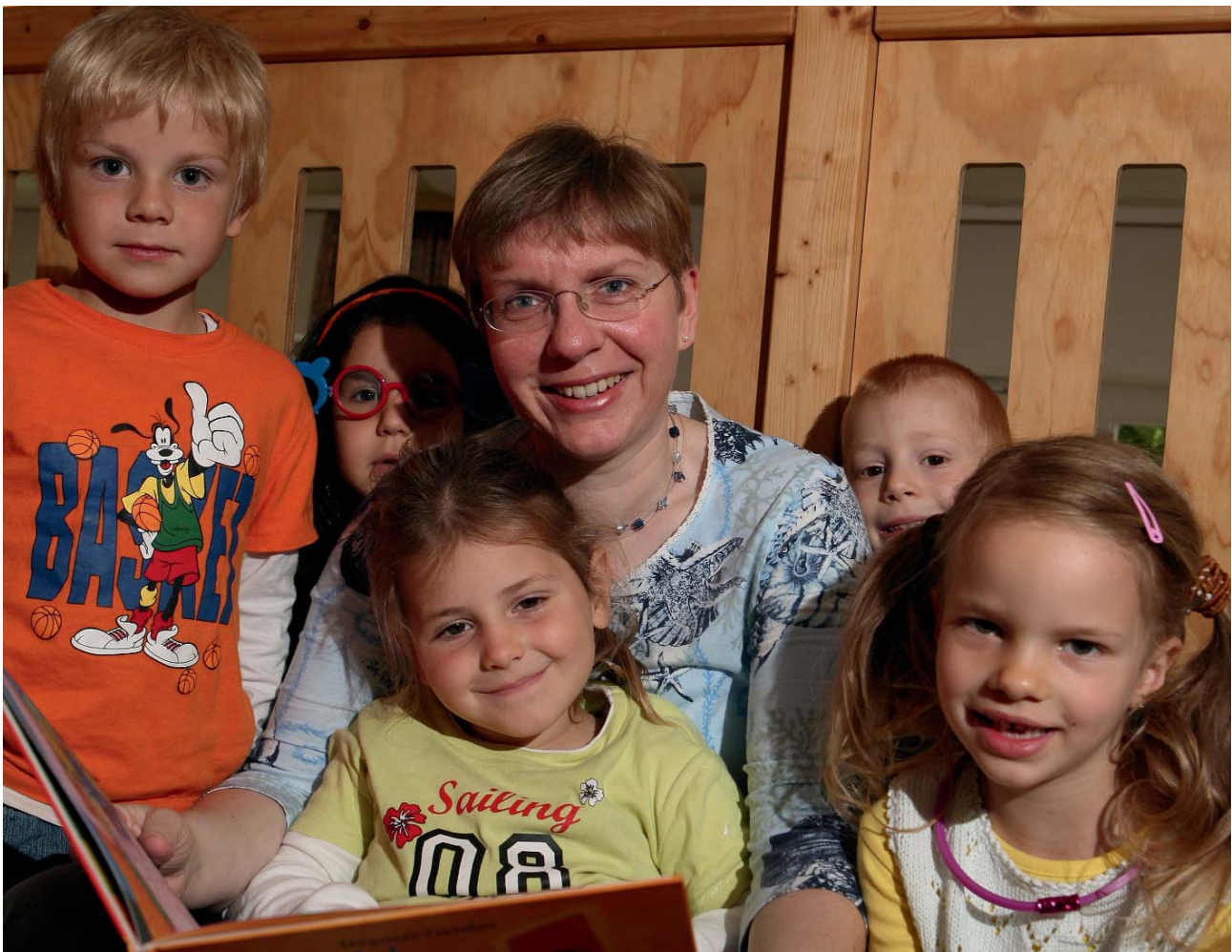
Vorlesepaten fördern das kindliche Bedürfnis, selbst zu lesen.

Vorlesepaten in 18 Büchereien, 32 Schulen, 59 Kindergärten und bei öffentlichen Veranstaltungen vor. Allein 2007 gab es rund 7.000 Vorleseinsätze für 30.000 Kinder. Der Verein Leseohren e. V. wählt die Vorlesepaten aus, organisiert Fortbildungsveranstaltungen und berät bei der Auswahl der geeigneten Literatur.