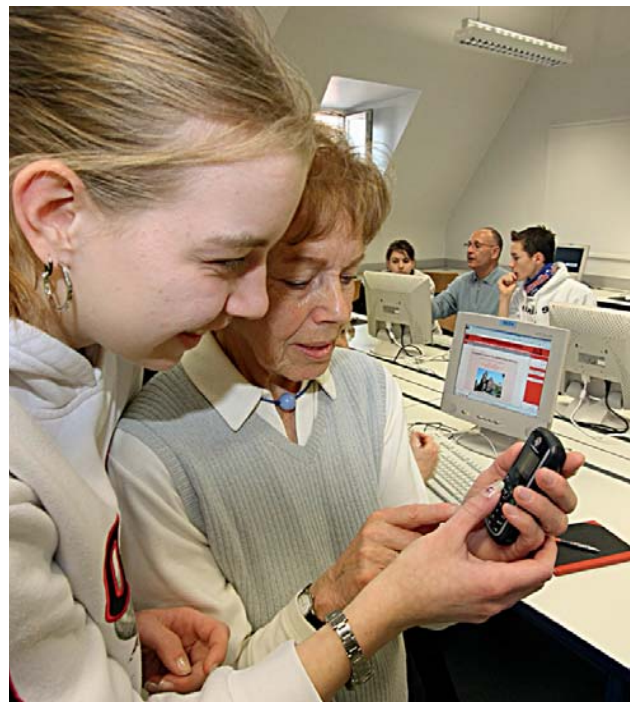
Alt und Jung können viel voneinander lernen.

Im Bewusstsein der Verantwortung für ältere langzeitarbeitslose Bürgerinnen und Bürger hat die Landeshauptstadt Stuttgart in dem gemeinsam mit der Agentur für Arbeit getragenen Job-