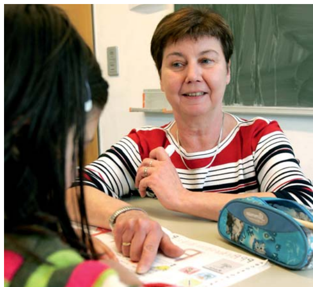
Hausaufgabenbetreuung im Haus 49

Die Hausaufgabenhilfe Degerloch – die offizielle Bezeichnung ist „Sprach-, Lern- und Hausaufgabenhilfe“ – gibt es ohne Unterbrechung seit 30 Jahren. In dieser privaten Initiative teilen sich ehrenamtlich 15 bis 20 Frauen und Männer die Arbeit an drei Nachmittagen pro Woche. Eines ihrer Hauptanliegen ist, die sprachlichen Defizite der Kinder abzubauen, Lesen und Dik-