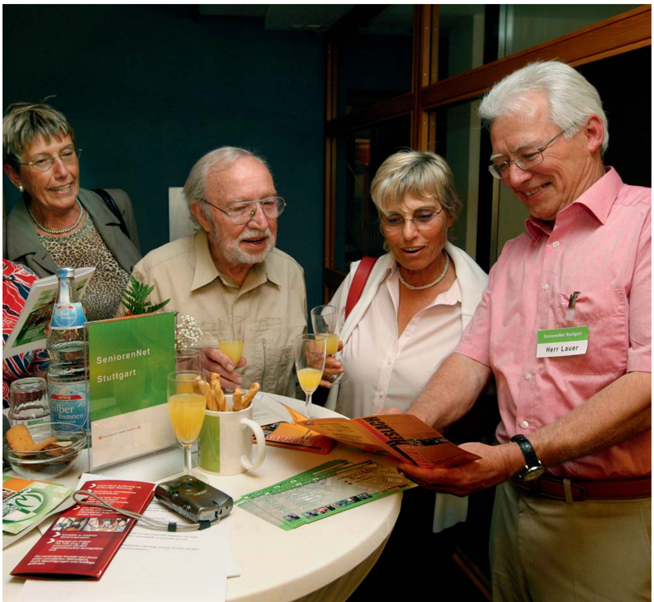
Die Interessengemeinschaft „SeniorenNet“ im Generationenhaus Heschlach will den Einstieg ins Internet für Seniorinnen und Senioren erleichtern.