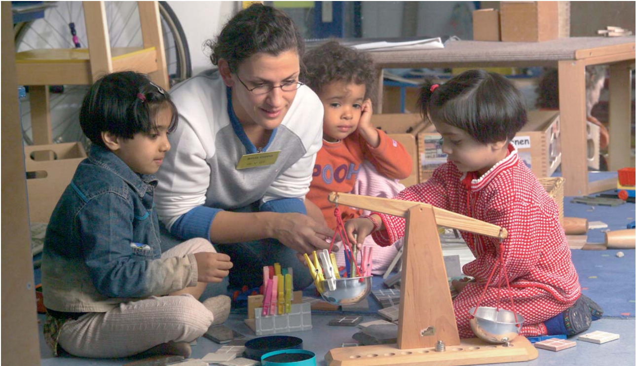
Fast die Hälfte der Stuttgarter Kinder stammt aus Einwandererfamilien.

dass es für unsere Kinder Platz zum Wohnen und Freiräume zum Spielen gibt; dass für die Gesundheit und die Sicherheit unserer Kinder gesorgt ist; dass die Vereinbarkeit von Familie und Beruf verbessert und durch einen neuen Generationenvertrag vor Ort das aktive Miteinander von Jung und Alt gefördert wird.